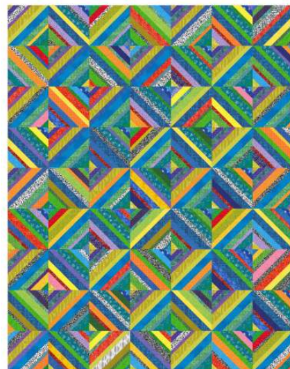
Huller om buller

Under första tillfället kan vi sedan diskutera vad vi ska jobba med i fortsättningen, kanske jag kan få fram mönster på min Sommarväska som jag vet många vill sy. Eller något helt annat. Eller så vill ni fortsätta med String Along:)