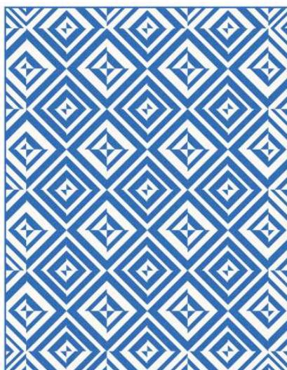
Enbart två färger