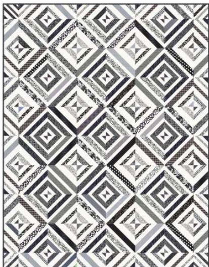
Många svarta-grå-vita tyger